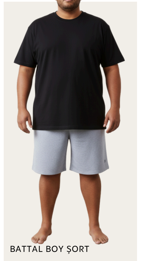
BATTAL BOY ŐORT