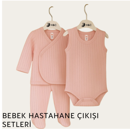
BEBEK HASTAHANE ÇIKIŐI SETLERİ