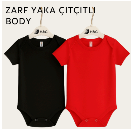
ZARF YAKA ÇİTÇİTLİ BODY