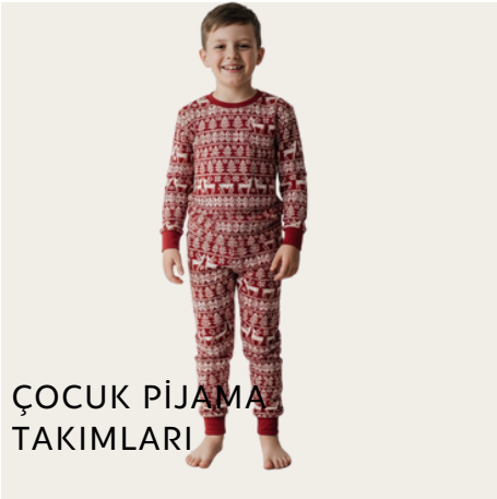
ÇOCUK PİJAMA TAKIMLARI