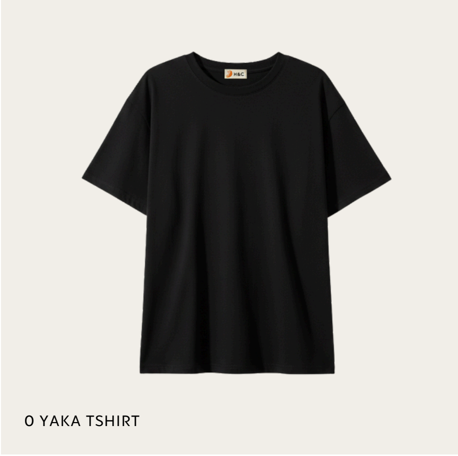
O YAKA TSHIRT