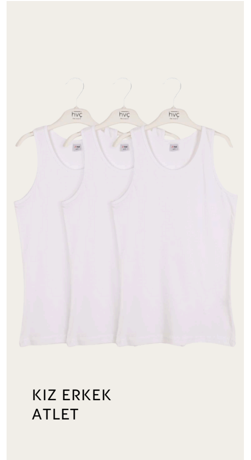
KIZ ERKEK ATLET